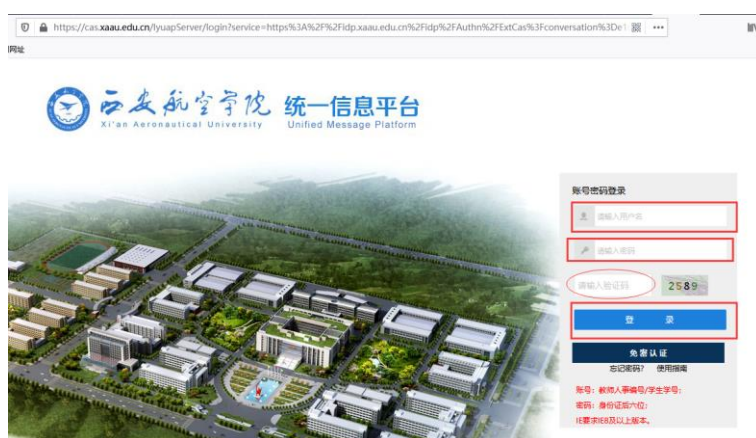
图 2 西航统一信息平台