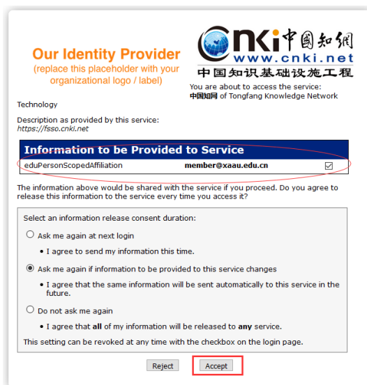
图 3 用户属性信息核验窗口