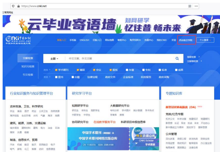
图 4 中国知网首页